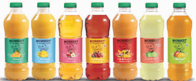
Orange Ananas Pomme Cranberry Multifruits Citron Vert Mangue