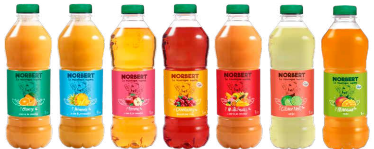
Orange Ananas Pomme Cranberry Multifruits Citron Vert Mangue

Document à usage professionnel. Les offres de ce document sont valables dans la limite des stocks disponibles. Toutes ces promotions sont réservées aux points de vente indépendants en France métropolitaine et Corse, hors clients nationaux bénéficiant d'une mercuriale nationale. C10-RCS Paris 414 229 450 00039. L'abus d'alcool est dangereux pour la santé, à consommer avec modération. Pour votre santé, pratiquer une activité physique régulière. Photos non contractuelles. Réalisation : ARISTID St-Denis - Impression : CFI Technologie.