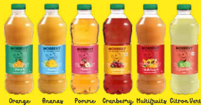
Orange Ananas Pomme Cranberry Multifruits Citron Vert